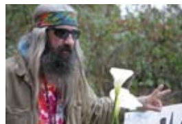
5D2354 56x37 cm 4 500,- Kč také/also 70x47 cm, 80x53 cm