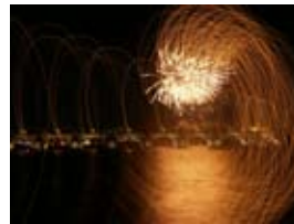
2A8208 70x53 cm 6 100,- Kč také/also 56x42 cm, 80x60 cm