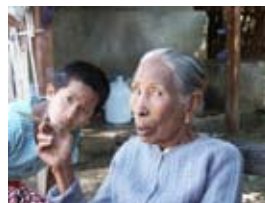
7D0931 70x53 cm 5 100,- Kč také/also 56x42 cm, 80x60 cm