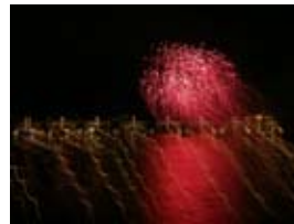
2A8230 70x53 cm 6 100,- Kč také/also 56x42 cm, 80x60 cm