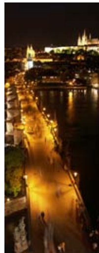
2A7020 45x115 cm 8 300,- Kč