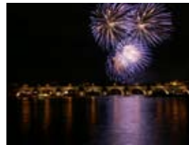
2A8237 70x53 cm 6 100,- Kč také/also 56x42 cm, 80x60 cm