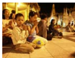
7D0119 56x42 cm 4 500,- Kč také/also 70x53 cm, 80x60 cm