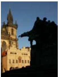
2A7069 53x70 cm 6 100,- Kč také/also 42x56 cm, 60x80 cm