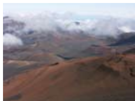
2A1769 70x53 cm 5 600,- Kč také/also 56x42 cm, 80x60 cm

Am morgen haben wir uns im Meer erfrischt und sind dann zum größten Krater der Welt aufgebrochen. Nach 50 Minuten Fahrt waren wir 3000 Meter über der Meeresoberfläche. Hinweisschilder warnten uns, uns langsam zu bewegen, da wir uns in großer Meereshöhe befanden. Wir spürten den Druck und die absolute Stille in unseren Schläfen. Keine Touristen, kein Ton und kein Wind. Wir setzten uns an den Rand des rosa Theater. Von der anderen tropischen Seite des Kraters stiegen Wolken auf und schwebten in unsere Richtung. Sie kamen aber nie bei uns an und lösten sich auf. Das natürliche rosa Theater besaß somit seinen Beleuchter und Maler ewig veränderlicher Schatten. Und wir staunten sprachlos.