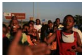
5D1396 56x37 cm 4 500,- Kč také/also 70x47 cm