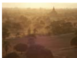
7D0849 70x53 cm 6 100,- Kč také/also 56x42 cm, 80x60 cm