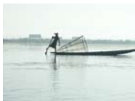
7D1103 70x53 cm 6 100,- Kč také/also 56x42 cm, 80x60 cm