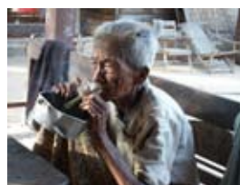
7D0819 70x53 cm 5 100,- Kč také/also 56x42 cm, 80x60 cm