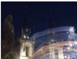
2A8075 70x53 cm 5 600,- Kč také/also 56x42 cm, 80x60 cm