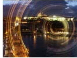
2A7005 70x53 cm 6 600,- Kč také/also 56x42 cm, 80x60 cm