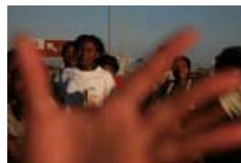
5D1400 56x37 cm 4 500,- Kč také/also 70x47 cm