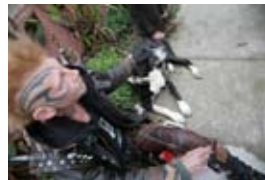
5D2363 56x37 cm 4 500,- Kč také/also 70x47 cm, 80x53 cm