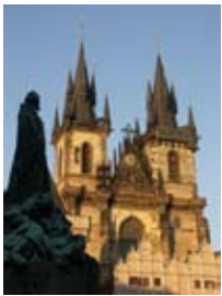
2A6497 60x80 cm 6 700,- Kč také/also 42x56 cm, 53x70 cm