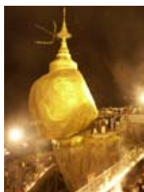
7D1380 53x70 cm 6 100,- Kč také/also 42x56 cm, 60x80 cm