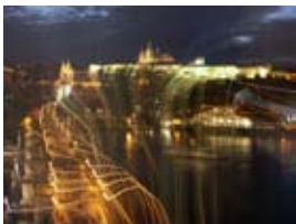
2A7008 70x53 cm 6 100,- Kč také/also 56x42 cm, 80x60 cm