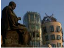
2A6556 70x53 cm 6 100,- Kč také/also 56x42 cm, 80x60 cm