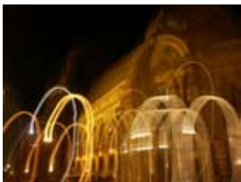
2A6714 70x53 cm 6 100,- Kč také/also 56x42 cm, 80x60 cm