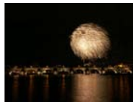
2A8244 70x53 cm 6 100,- Kč také/also 56x42 cm, 80x60 cm