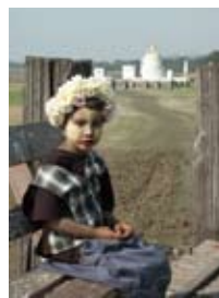
7D0266 53x70 cm 5 600,- Kč také/also 42x56 cm, 60x80 cm