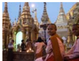
7D0062 56x42 cm 5 000,- Kč také/also 70x53 cm, 80x60 cm