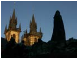
2A7073 80x60 cm 6 700,- Kč také/also 56x42 cm, 70x53 cm