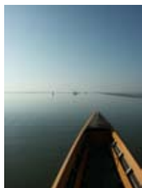
7D1095 53x70 cm 6 100,- Kč také/also 42x56 cm, 60x80 cm