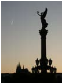
2A6288 53x70 cm 6 100,- Kč také/also 42x56 cm, 60x80 cm